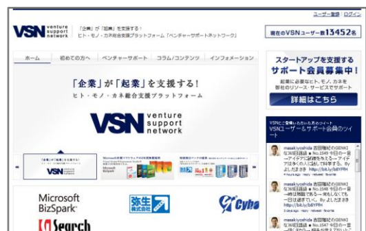
【VSNのウェブサイトトップページ】