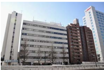
[katana オフィス渋谷外観図]